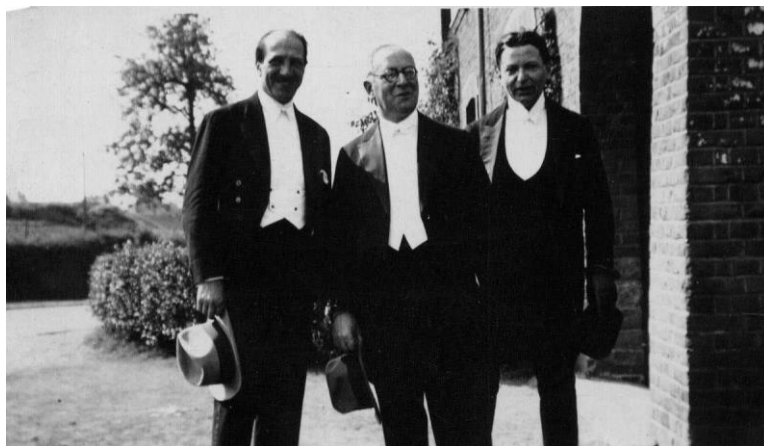
Fig. 5. Violoniștii Jacques Thibaud, Carl Flesch și George Enescu la Jupille, 1933