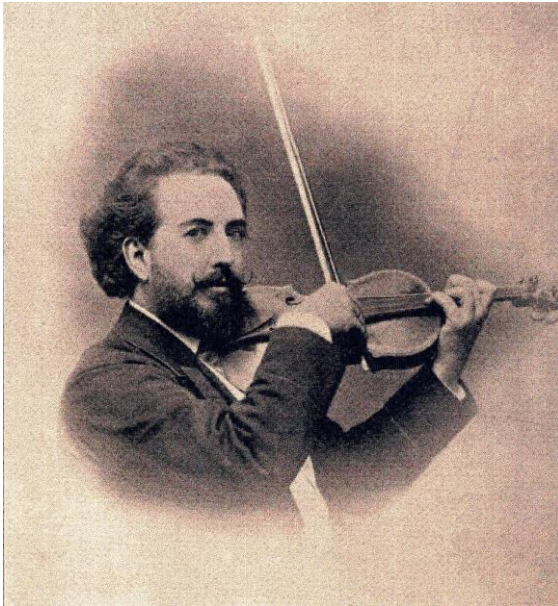
Fig. 1. Fotografie Martin-Pierre Marsick

Compozitor, violonist virtuoz cu numeroase prezențe scenice în Europa și America, profesor de vioară renumit, a îndrumat instrumentiști deveniți celebri, printre care Carl Flesch și Jacques Thibaud. În convorbirile cu Bernard Gavoty, George Enescu sintetiza atât amintiri despre profesorul său, cât și evoluția violonistică proprie la Conservatorul din Paris: